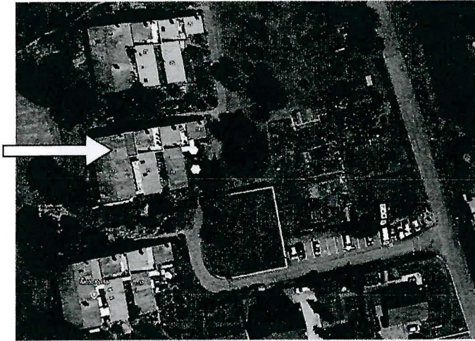
Velux de 78 x 118 cm