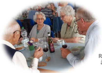
Repas d'automne à Treykovagnes, 18.09.2024