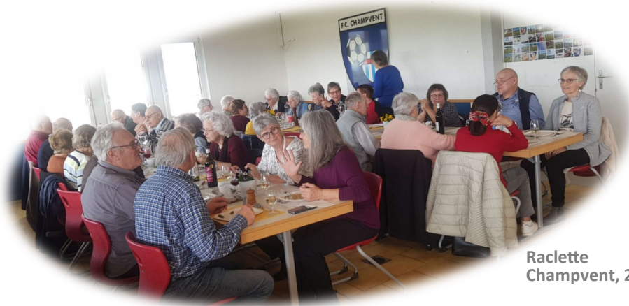
Raclette Champvent, 21.02.2024